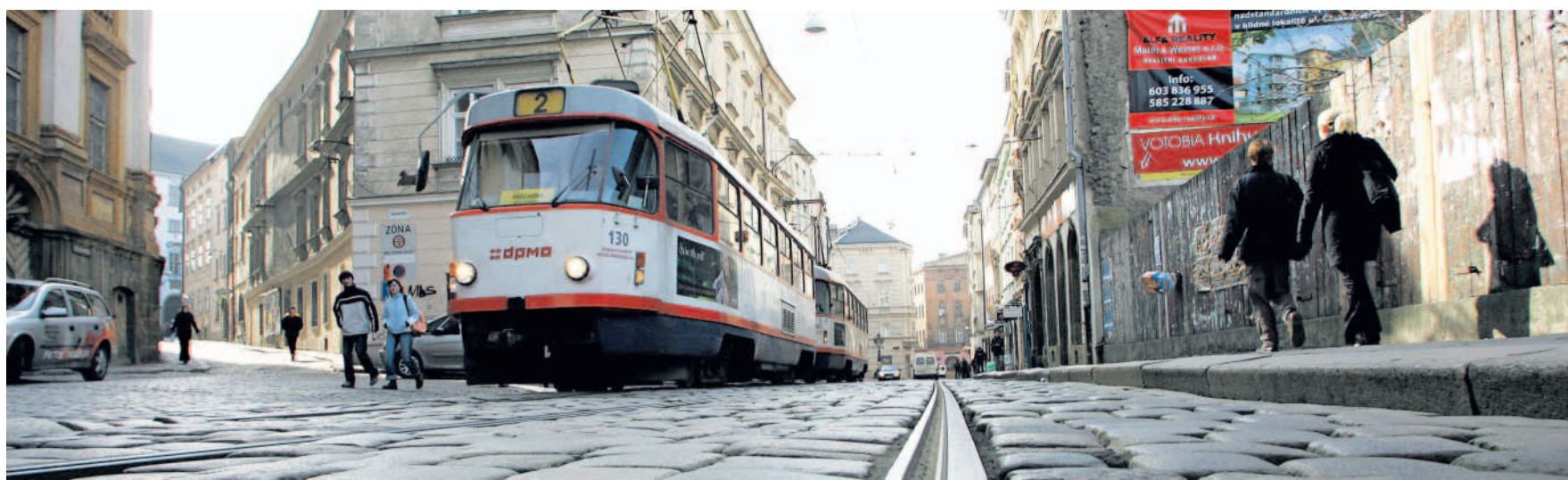
Ještě po kostkách Po frekventované spojnici centra města a hlavního nádraží jezdí tramvaje beze změn, zmizely jen „kočičí hlavy“ v Denisově a Pekařské ulici.